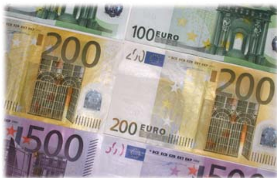
Los cuerpos de seguridad de la UE se coordinan en Europa para luchar contra los delincuentes internacionales que falsifican el euro.