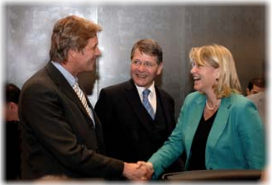
Los Ministros de cada país de la UE se reúnen en el Consejo para tomar decisiones conjuntas sobre las políticas y la legislación de la UE.