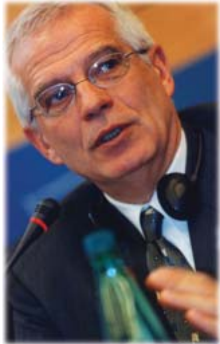
Josep Borrell Fontelles fue elegido Presidente del Parlamento Europeo en 2004.