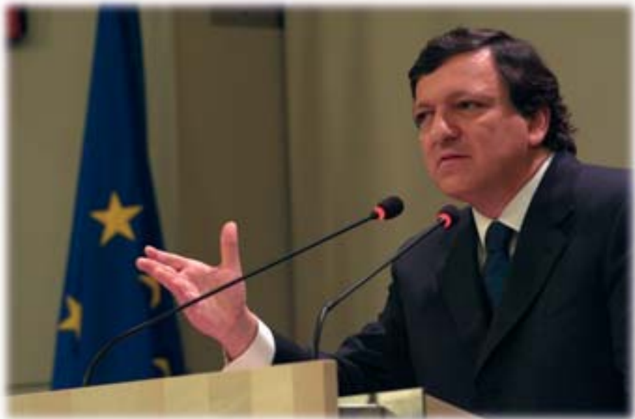
José Manuel Barroso fue elegido Presidente de la Comisión Europea en 2004.

bunal de Justicia de las Comunidades Europeas, que puede imponer sanciones. Las sentencias del Tribunal son de obligado cumplimiento para los Estados miembros y las instituciones de la UE.