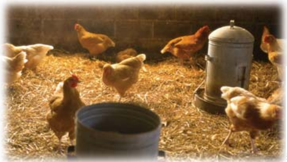
La Autoridad Europea de Seguridad Alimentaria contribuye a garantizar la seguridad del proceso de producción de alimentos: «desde la granja al plato».

El Cedefop también desarrolla una página Internet interactiva denominada «Aldea electrónica de la formación», accesible en: www.trainingvillage.gr