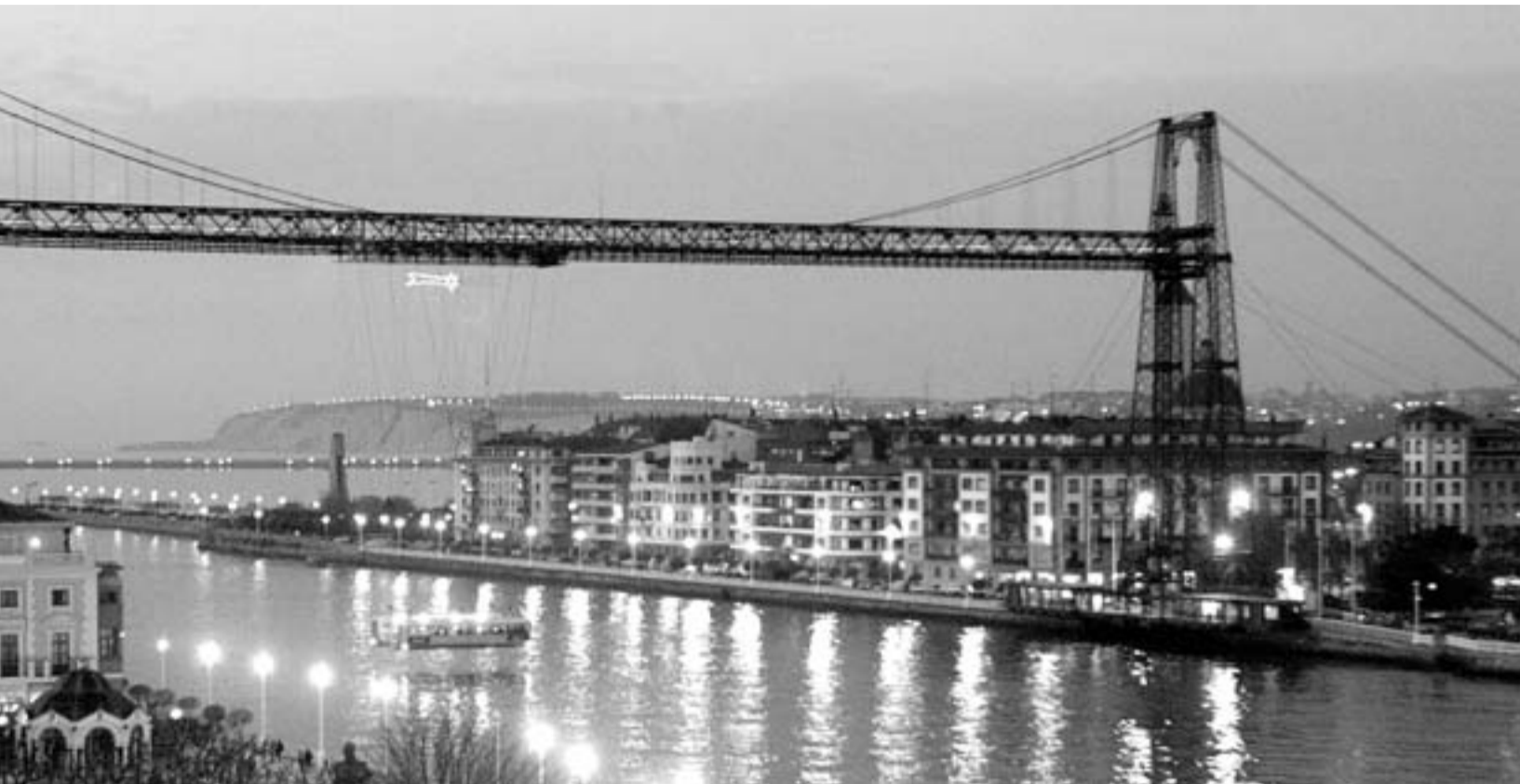
Colgante une las orillas de Portugalete y Getxo y se ha convertido en una referencia turística de primer orden.

Alumnos del centro de fotografía cerrado en Bilbao exigen una salida a Educación Temen perder el curso y culpan al Gobierno vasco de no controlar la academia