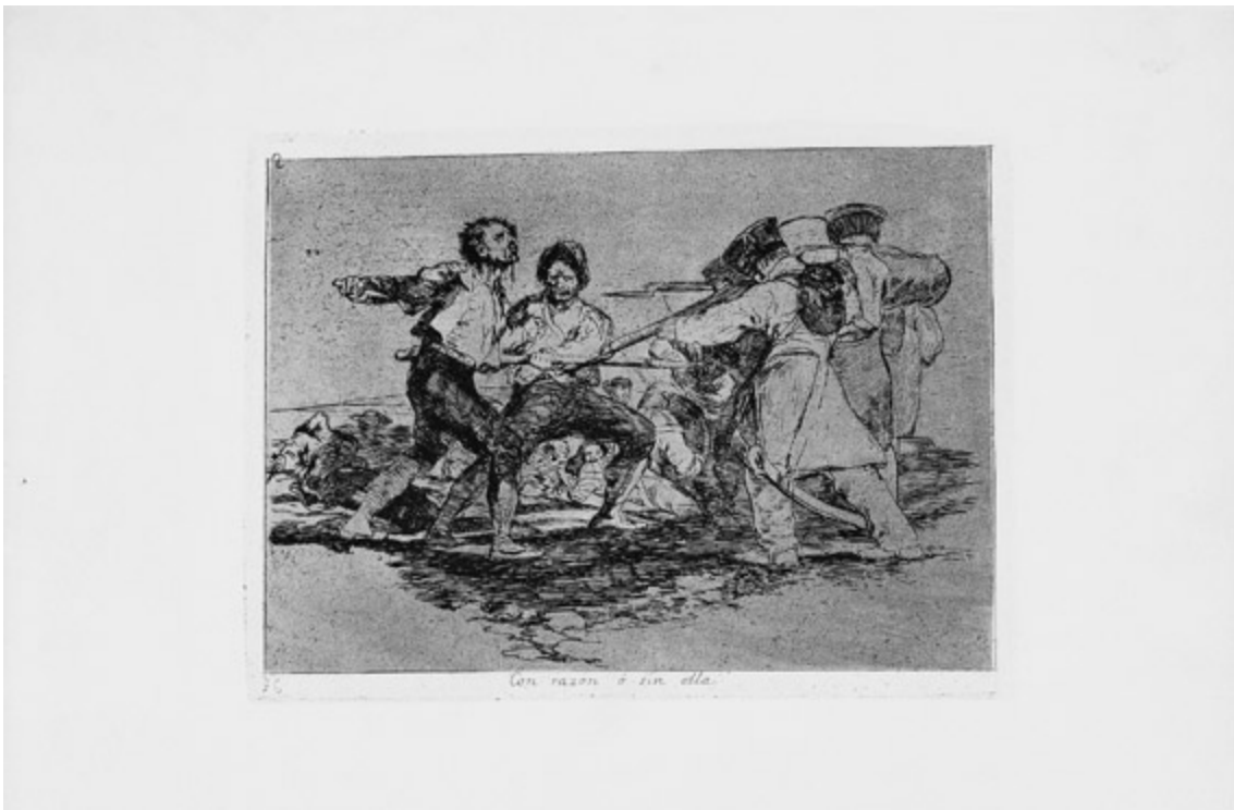
Francisco Goya, Con razon ó sin ella. Desastre de la guerra, núm. 2, 1812-15

Madrid, Biblioteca Nacional. Inv. 45685 / 1.