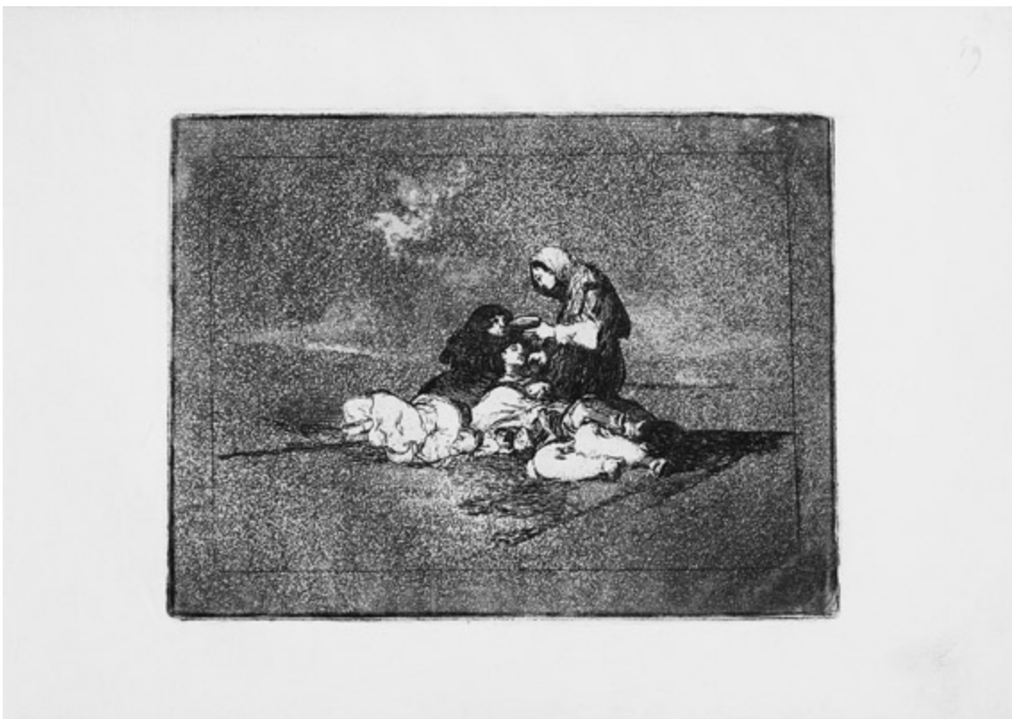
Francisco Goya, De qué sirve una taza? Desastre de la guerra, núm. 59, 1812-15.

Madrid, Biblioteca Nacional, Inv. 45685 / 38.